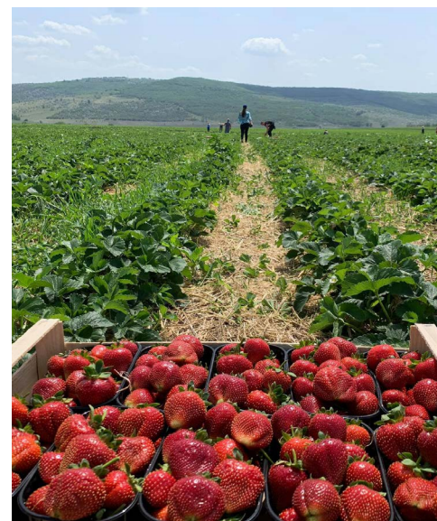
Erdbeerernte in der Republik Moldau.

aufgrund eines Beschlusses des Deutschen Bundestages